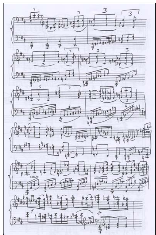
J. Kosma : Sonate 1940 , extrait © 2006 by Editions Rubin